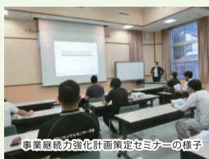
事業継続力強化計画策定セミナーの様子

令和3年度は災害や不測の事態に強い経営をめざすための「事業継続力強化計画策定セミナー」を開催、青年部員事業所10社が計画策定し、経済産業省の認定を受けることができました。また、地域ボランティアとして清掃活動を行うなど、コロナ禍でも積極的に自社の発展、地域貢献に努めています。