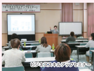
ビジネススキルアップセミナー

これらの活動を通して女性部員それぞれの会社、お店が元気になれるように頑張っています。