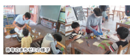
昨年のまちゼミの様子

「まちゼミ」とは商店と消費者との交流を通して、商店のファンづくりと地域活性化を図ることを目的に、店主やスタッフが講師となり、プロならではの専門知識や情報、コツを無料で受講者(消費者)にお伝えする少人数のゼミナールです。