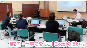
第2回 仕事で役立つ! Excelの使い方

インボイス制度開始から半年が経過し、それぞれ不安に思っていることなど現在の状況確認と再確認を行いました。