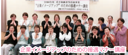
企業イメージアップのための接客マナー講座

働く女性達を中心に、相手に与える印象やセルフマネジメントする手法と接客マナーを習得することができました。今後の円滑なコミュニケーション実現による企業イメージアップとリピーター増加が期待されます。