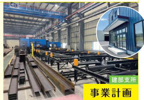
建部支所 事業計画

ご感想 ：計画書の作成は自社だけでは難しいですが、アドバイスを受けながら作成することができました。主体的に取り組むことで今後の成長や事業展開につながると感じています。日頃より商工会には相談に乗っていただいております。引き続き支援をお願いしたいと思っています。