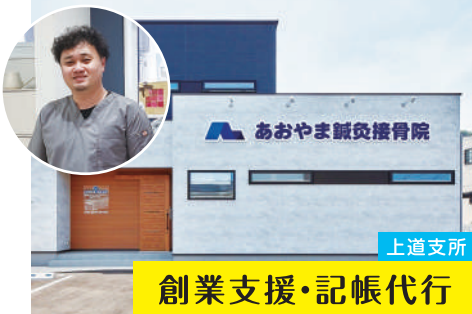
上道支所 創業支援・記帳代行

ご感想 ：自己資金が限られた中での創業融資でしたが、余裕を持って運転資金を借り入れることができたため、スムーズに事業を開始できました。商工会は当院から徒歩数分圏内にあるため、記帳に関しては毎月の日計表を持参するなど大変便利です。商工会関係の方からの口コミ客等もあり、順調に経営出来ていますが、まだまだこれからだと考えています。今後も経営で相談したい事がある際は、商工会を上手く活用したいと思います。